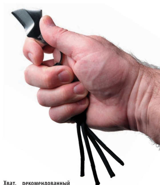
Хват, рекомендованный для ножа Batwing

С быстротой извлечения далеко не все так однозначно. Сформировавшееся в обществе отрицательное отношение к ножам вынуждает носить их более-менее скрытно. Это, в свою очередь, означает, что нож (или большая его часть) должен быть размещен в кармане или закрыт верхней одеждой. В таких условиях быстрота извлечения во многом определяется доступом к месту ношения ножа, а не его конструкцией.