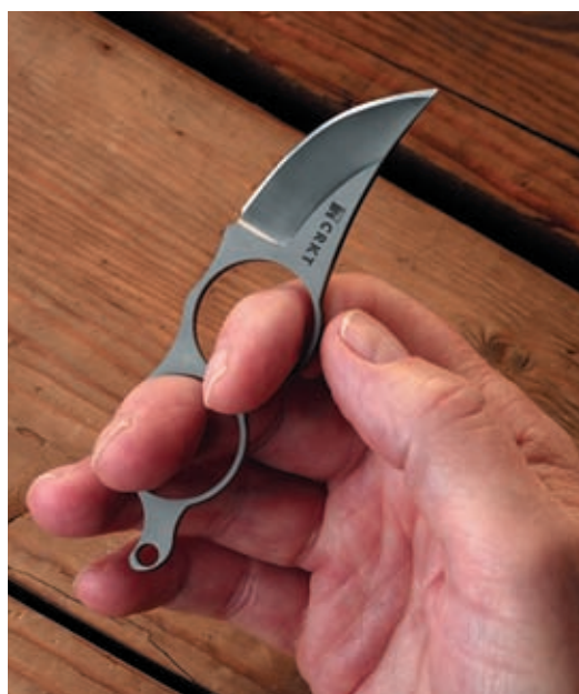
CRKT A.G.R. Ringer™ 3 (создатель A.G. Russell) – на складном ноже подобную рукоятку реализовать нельзя

(при толщине обуха более 2,4 мм и «нетравмоопасной» рукояти), при превышении которого нож расценивается как оружие. В ряде зарубежных стран и некоторых штатах США действует еще более суровое законодательство, согласно которому для рядового гражданина легальным является ношение нескладного ножа с клинком не длиннее 3,5 дюйма (89 мм) или даже всего 3 дюймов (76 мм). Подобные жесткие ограничения, однако, не остановили создателей ножей, а, наоборот, подтолкнули их на поиск оригинальных конструктивных решений, обеспечивающих эффективность и удобство при малых габаритах. Более того, самые интересные образцы, в наибольшей степени реализующие потенциал схемы с нескладным клинком, созданы исходя из ограничения именно в 3 дюйма.