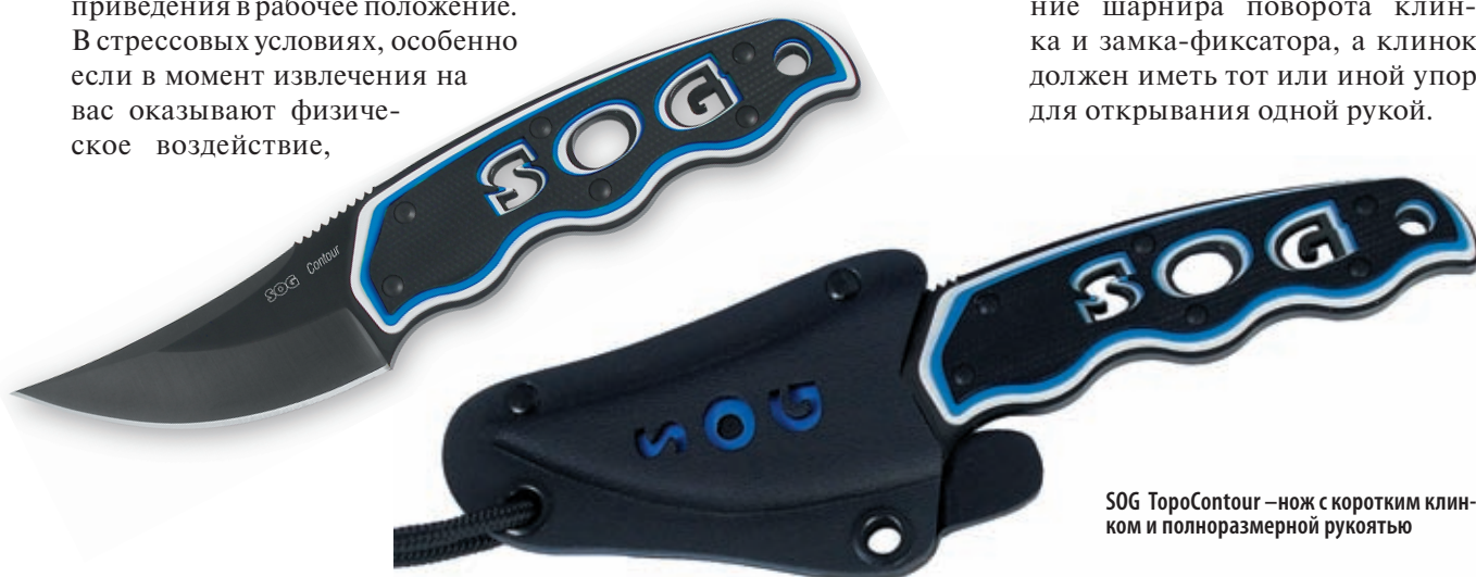
SOG TopoContour – нож с коротким клинком и полноразмерной рукоятью

Во-вторых, рукоять складного ножа в общем случае должна предусматривать размещение шарнира поворота клинка и замка-фиксатора, а клинок должен иметь тот или иной упор для открывания одной рукой.