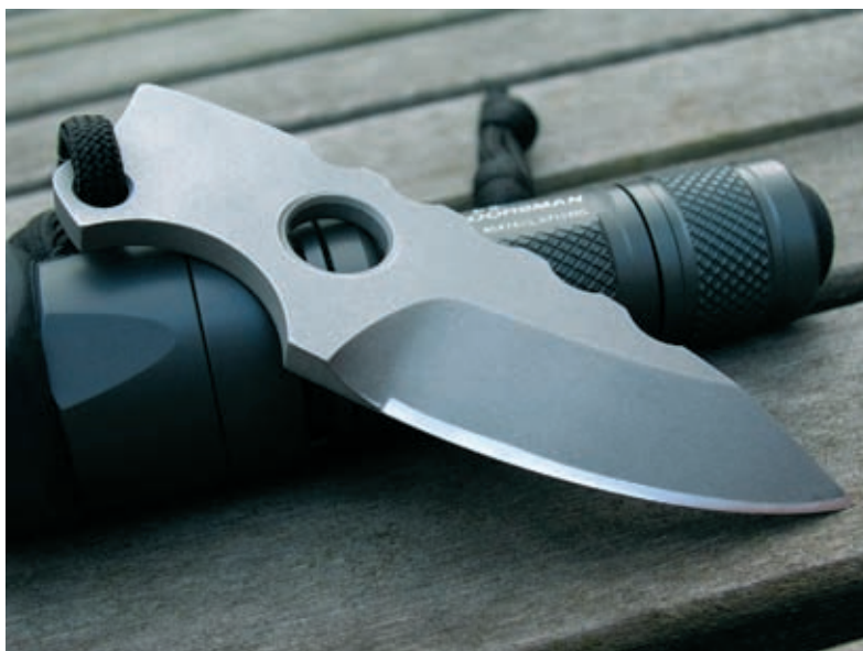
Рукоять складного ножа может быть и меньше клинка – нож VoxMegaMini (создатель Jesper Voxnes)