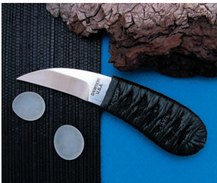
Tiger Claw (создатель Barry Dawson) – миниатюрный нож для самообороны, длина клинка 50 мм