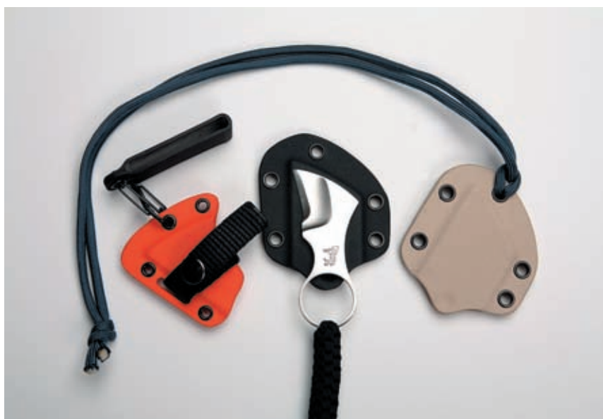
Batwing от Blind Horse Knives – один нож и три варианта ношения (брелок для ключей, ножны на пояс и подвес на шею)